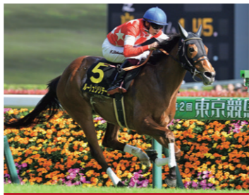
血統関連馬 ルージュソリテール

遅生まれで大きくはないものの、中身がしっかり詰まっている馬体。母も半姉ソリテールも、成長曲線としては緩やかで息長く活躍しつつ完成するタイプですから現状は気にしていません。この配合ならマイルあたりが主戦場でしょう。騎手の選択に関しては、個々の馬に合わせることはもちろん、アスリートとしてプロ意識を持って馬と成長してくれる騎手をお願いしています。また私自身も積極的に調教で跨り、すべての馬に乗ることで、その馬の個性や足りないものを見つけ競走生活に活かしています。