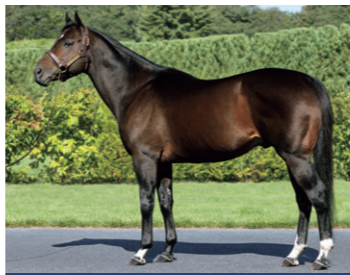
ニューイヤーズデイ ●24年ミアッドラヴがG1全日本2歳優駿に優勝

G1スピンスターSを含め、米重賞を計3勝した強豪牝馬インランジェリーの娘である母。米2歳G1BCジュヴェナイルの勝ち馬で、種牡馬となり米日でG1優勝馬を送り出している父ニューイヤーズデイ。この2頭のマッチングから産まれた初仔は、ダート戦線の名馬誕生を予感させる希望に満ちた存在感を放ちます。太く逞しいクビ、幅と深みがあり胸筋が発達した胸前、短めの背中、容積が大きいトモ、ボリューム感満点の胴、脚向きが綺麗な前肢、骨格が良く飛節の伸びも良好な後肢といったパーツからなる馬体は、筋肉質でまとまりの良さが特徴となっています。また、重心の低さ、身のこなしのダイナミックさも有力なセールスポイント。気性に落ち着きがあり、順調に育成過程を乗り切りステップアップできるタイプで、2歳秋から完成度の高い走りを披露してくれると見えています。