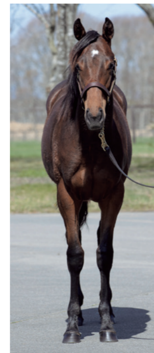
ウインドインハーヘア:M3×S4 Mr.Prospector:S4×S5