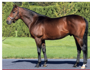
エフフォーリア ●3歳時G1を3勝、本年より初年度産駒がデビュー

長篠Sを含む4勝をあげ、G3中京記念3着、G2阪神牝馬Sでは1番人気に推されるなど重賞での実績も持つ母の初仔は、供用初年度から圧倒的な人気を博している父エフフォーリアと配合されて登場。言うまでもなく血統的な期待が大きい牝駒です。高く力強いクビ、厚み深みがあり胸筋も十分に付いている胸前、腰の部分の造りが素晴らしくラインの綺麗な背中、形状が良く容量も大きいトモ、伸びやかで助張りも良好な胴、やや外向気味も骨格がしっかりとしている前肢、飛節の可動域が大きい後肢といったパーツを保持する馬体は、優れた柔軟性と、バランスの良さを誇っています。母は悍性の強いタイプでしたが、本馬は落ち着いていて、気性面の難しさが無い点も強調材料。芝のマイルから中距離で一線級へと駆け上がっていく雄姿を見せて欲しい新星です。