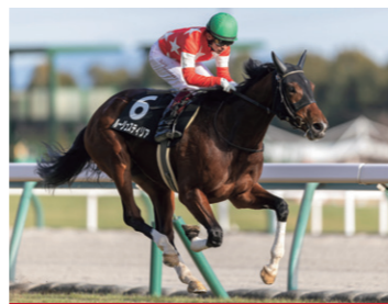
血統関連馬 ルージュスティリア

初仔ですが立派な素晴らしい馬体。バランスが良く品のある佇まい、柔らかく伸びのある歩きが母に似ています。配合的にも魅力があり、今から桜路線が楽しみです。古馬G1なら馬の成長に合わせて進められますが、一度限りの3歳春は能力を秘めていても、成長を早めるコントロールは人の手で出来ないもので、早期から活躍できる馬との巡り合いが鍵。ぜひ本馬で牝馬クラシックを狙いたいと思います。調教では基礎訓練が最も重要。故障を少なくし、馬を高いレベルへ引き上げる最善策と考えています。